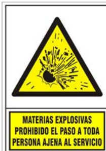
(*) SEÑAL 322