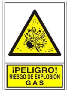
(*) SEÑAL 353