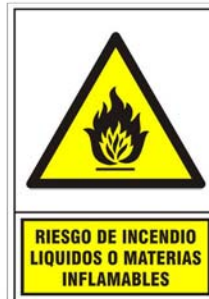
(*) SEÑAL 320