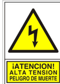
(*) SEÑAL 338