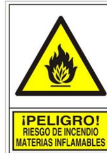
(*) SEÑAL 347