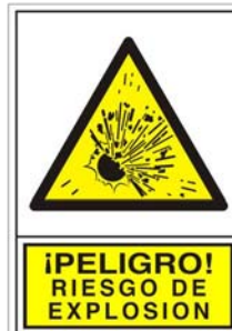
(*) SEÑAL 350