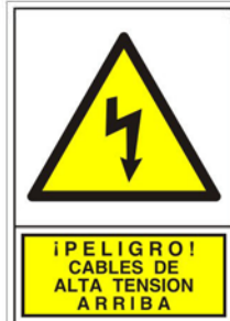
(*) SEÑAL 337