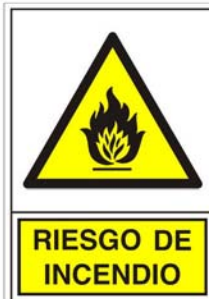
(*) SEÑAL 319