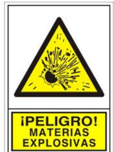
(*) SEÑAL 352