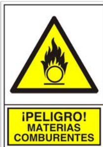
(*) SEÑAL 345