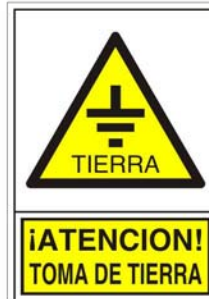
(*) SEÑAL 343