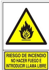
(*) SEÑAL 349