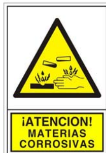
(*) SEÑAL 355