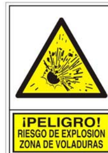
(*) SEÑAL 351