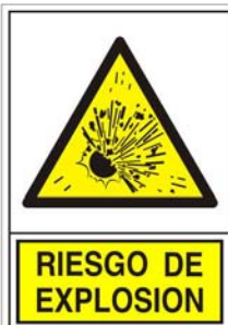
(*) SEÑAL 321