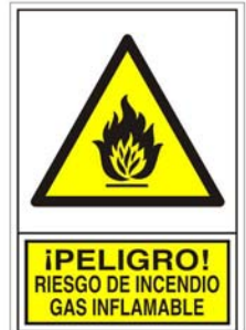
(*) SEÑAL 348