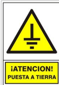
(*) SEÑAL 318