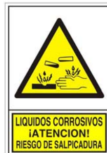
(*) SEÑAL 356